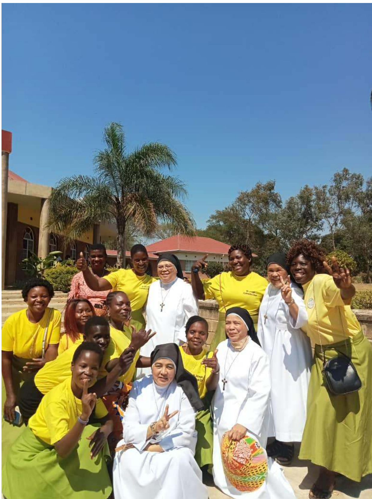
FOTO CON IL CORO DELLA CATTEDRALE