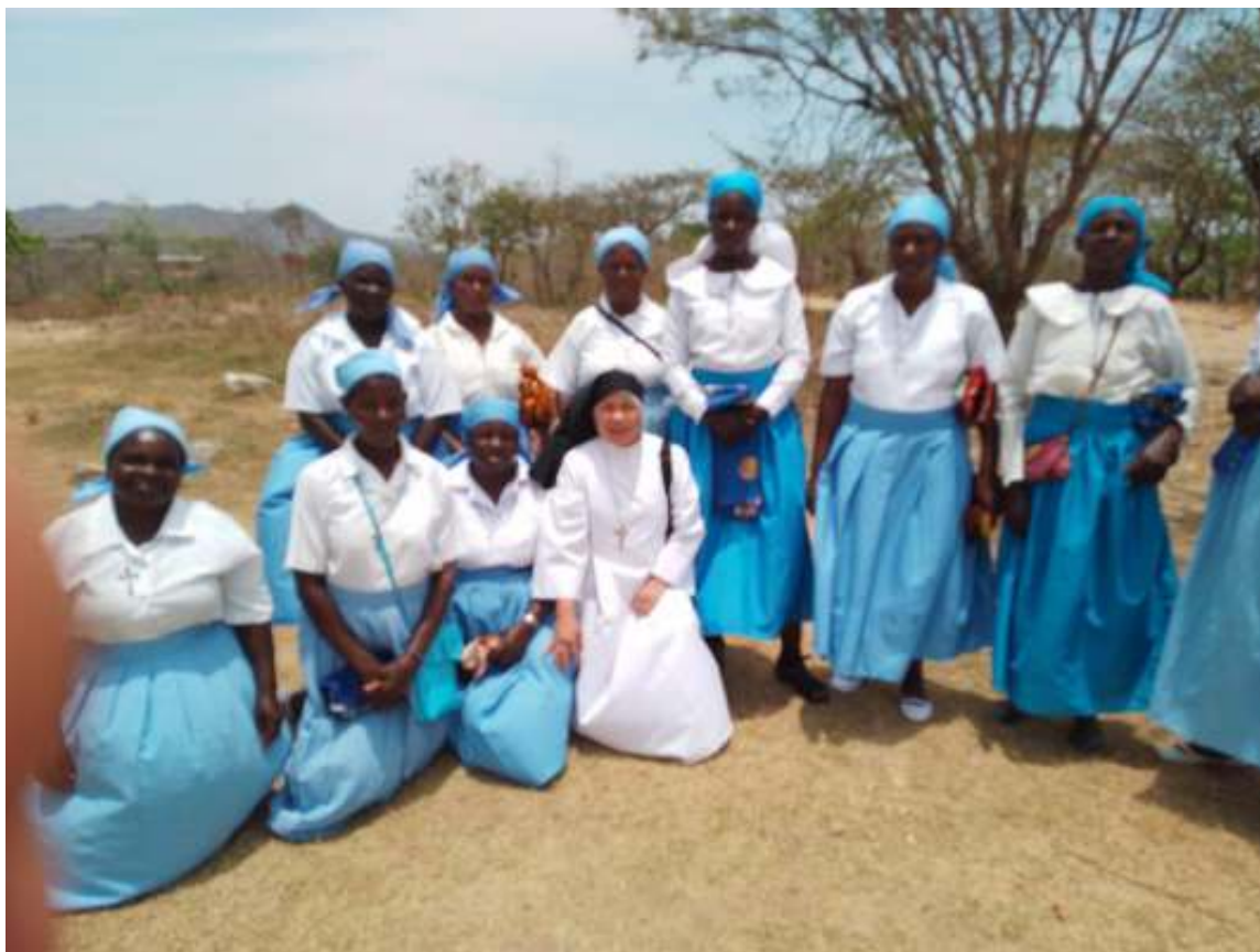
LE NOSTRE DOMENICHE