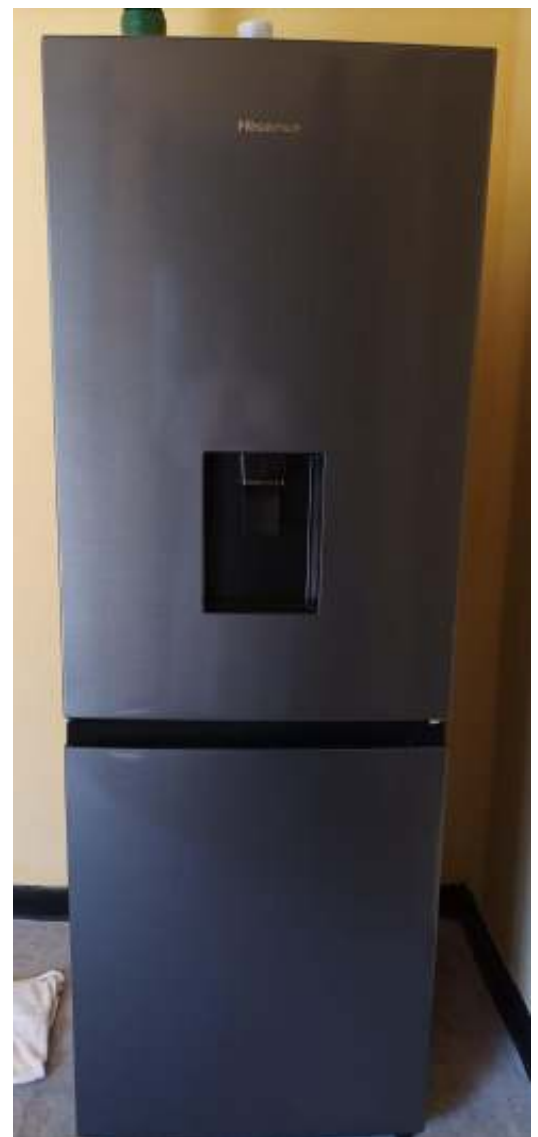
Un frigorifero di medie dimensioni