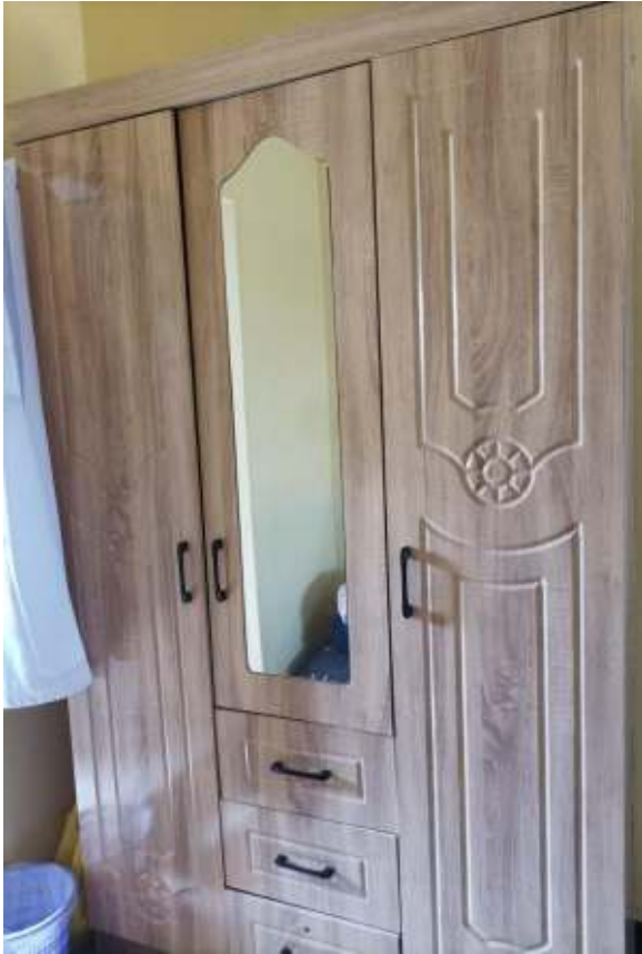
Un armadio per la camera da letto