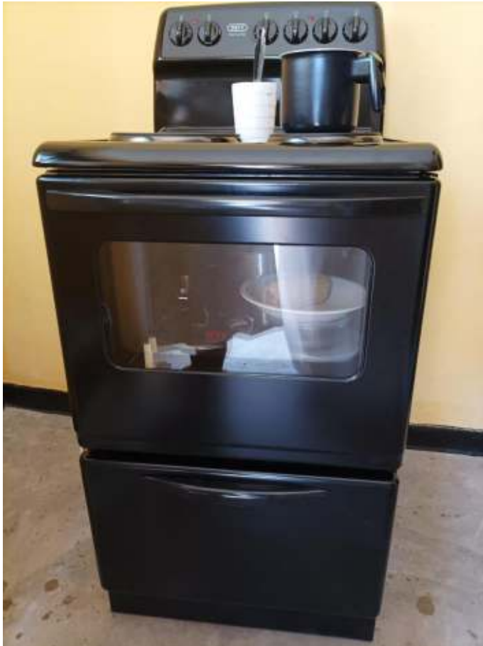
Una cucina elettrica con piastre e forno