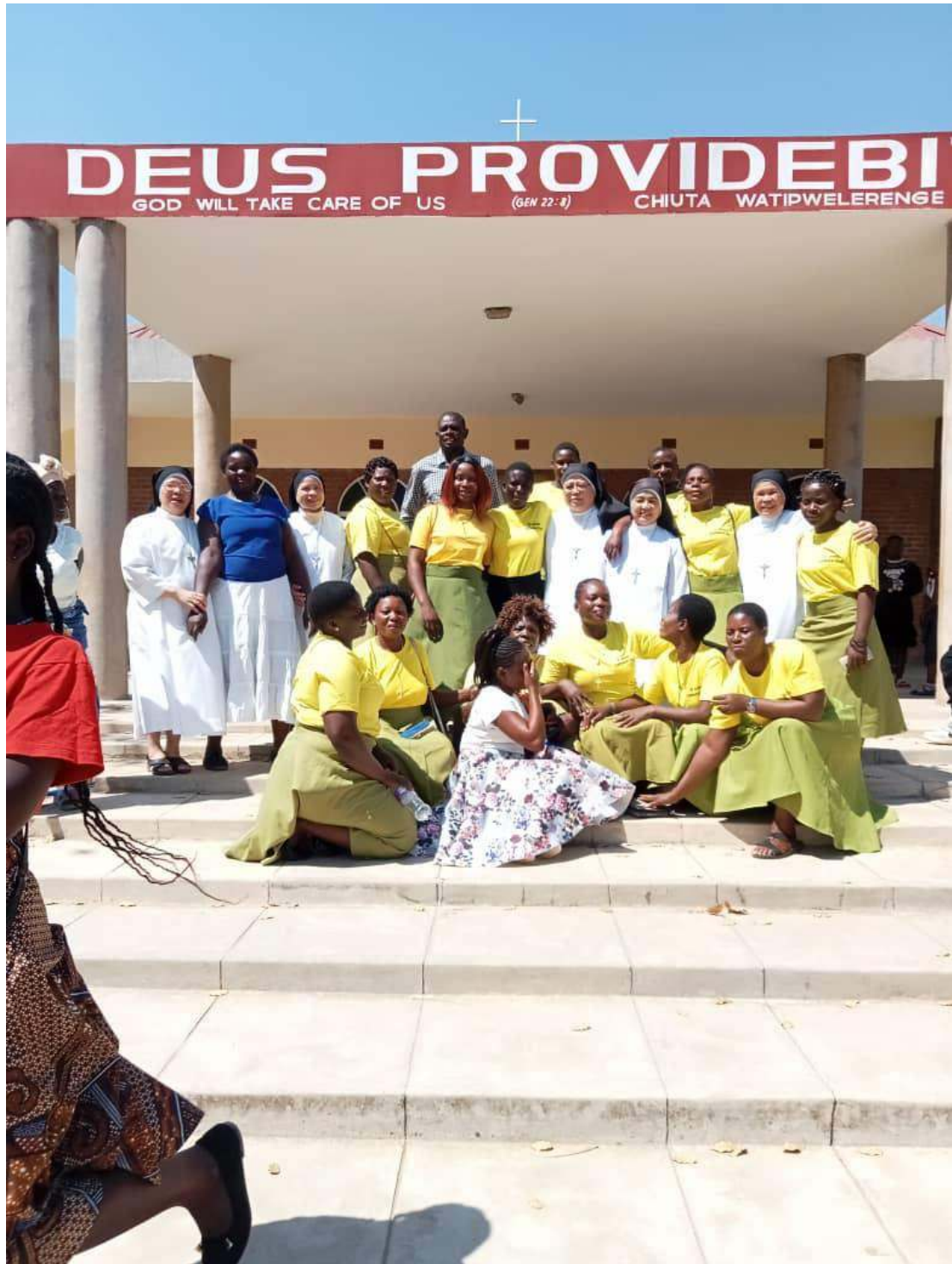
FOTO CON IL CORO DELLA CATTEDRALE