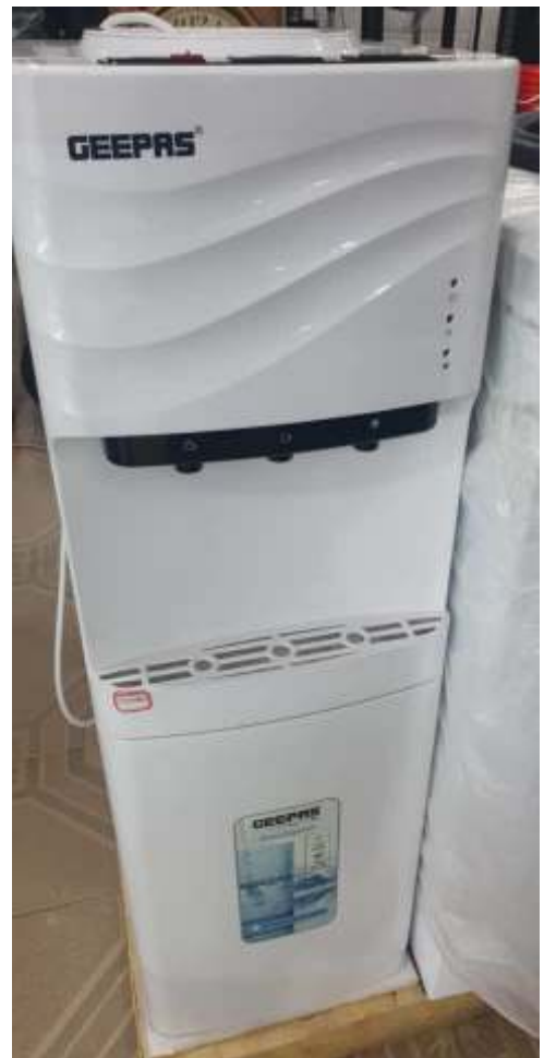
Un water dispenser elettrico