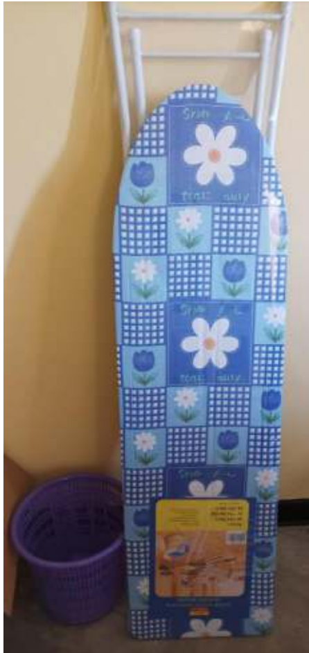
Un asse da stiro